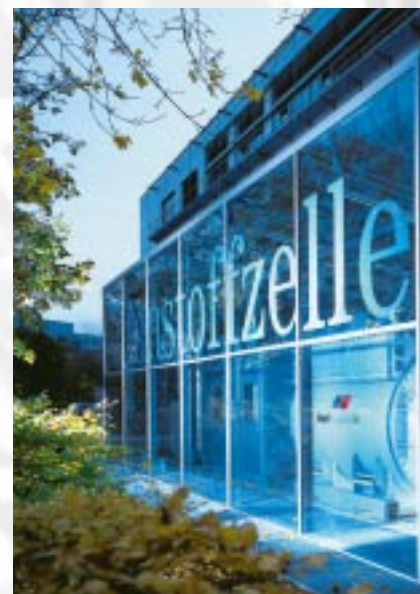
Die MTU Brennstoffzelle der DeTeImmobilien in München.