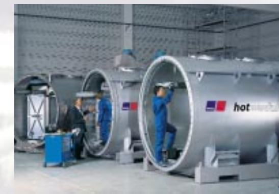
Sauber, effizient und zukunftsweisend: das Brennstoffzellen-Kraftwerk HotModule von MTU.

Inbetriebnahme der Brennstoffzellenanlage