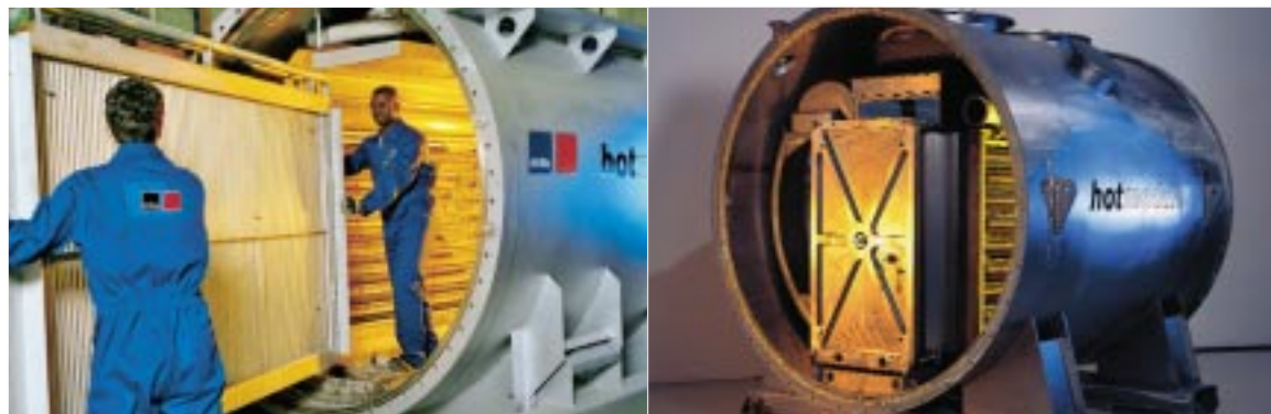
Das HotModule der MTU Brennstoffzelle erzeugt bei ca. 650 Grad Celsius rund 250 kW Strom und 170 kW thermische Energie.

Flexible Power-Unit: Nach einer Lebensdauer von etwa zwei-einhalb Jahren läßt sich der Zellblock des HotModules ohne großen Aufwand austauschen.