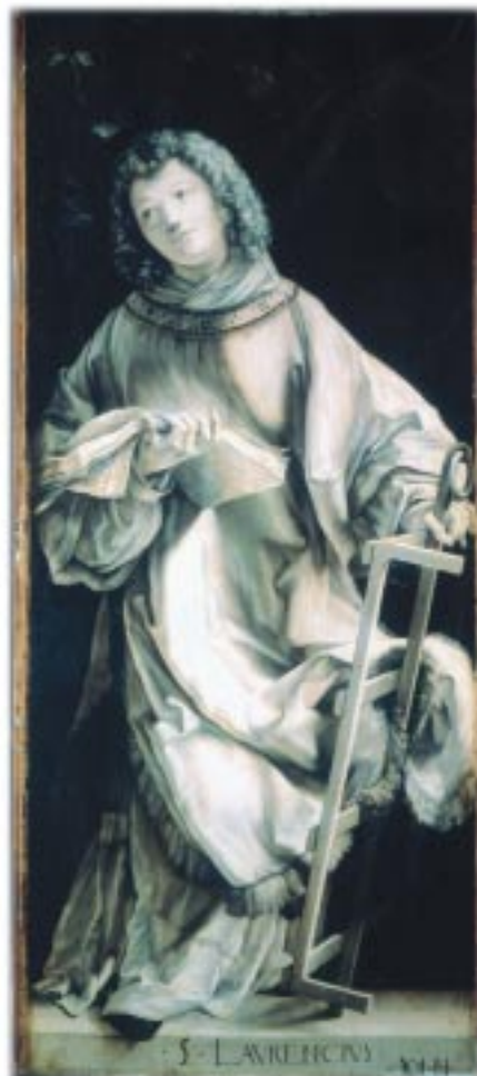
Hl. Laurentius, 1509/1510, Gemälde (Tempera/Tannenholz).

Einen großen Teil seines Lebens verbrachte der Künstler in der damaligen Nebenresidenz der Fürsten von Mainz, dem heute bayerischen Aschaffenburg. Im Schloss Johannisburg, das im frühen 17. Jahrhundert erbaut wurde, findet die Ausstellung statt. Im Vorgängerbau des Schlosses wirkte Grünewald als Baumeister der Erzbischöfe von Mainz