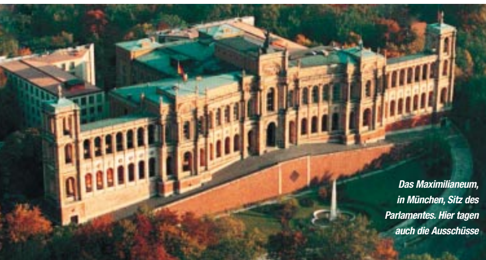
Das Maximilianeum, in München, Sitz des Parlamentes. Hier tagen auch die Ausschüsse